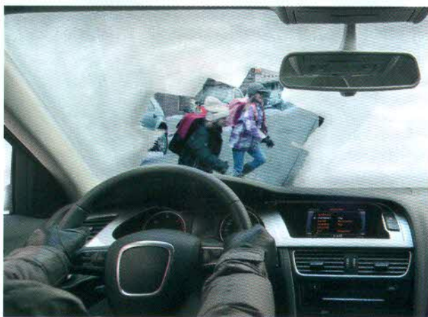
Затянутые наледью окна, выстуженный салон – обо всем этом предпусковой подогреватель позволяет забыть

Словом, выбор за вами: если у вас в машине уже установлен догреватель, вы вполне можете получить подогреватель, установив апгрейд-комплект; если нет догревателя, то установка предпускового подогревателя решит вопрос с запуском двигателя и прогревом салона. Решайтесь – зима приближается. Только советуем иметь в виду, что установку оборудования Eberspächer, его дооснащение и обслуживание рекомендуется производить в авторизованных центрах, специалисты которых прошли обучение. ●